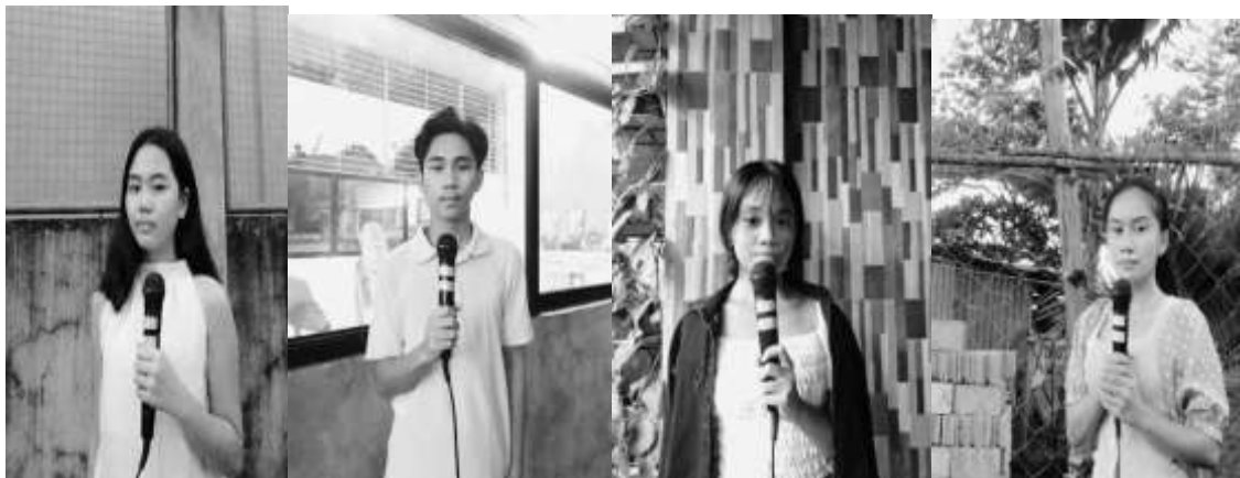
- Mga mag-aaral ng Dibisyon ng Lungsod Silay

Panuto: Ang mga nasa larawan sa ibaba ang bumubuo sa broadcasting team . Kilalanin kung kaninong linya ang sumusunod na pahayag. Isulat lamang ang bilang ng iyong sagot sa sagutang papel.