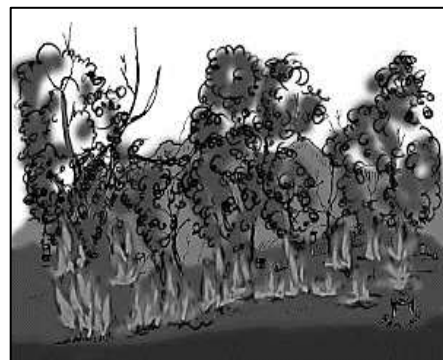
Labis na pagputol sa mga puno