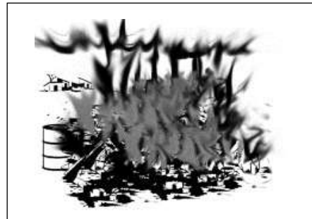
Nagsusunog ng mga basura