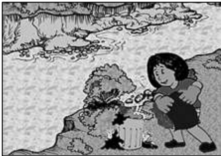
Nagtatapon ng basura sa ilog

Magbigay ng solusyon sa mga suliraning ipinakikita sa mga sumusunod na larawan. Isulat ang sagot sa sagutang papel.