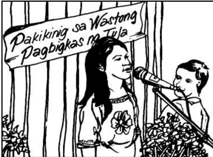
Guhit ni: Rolando S. Cada