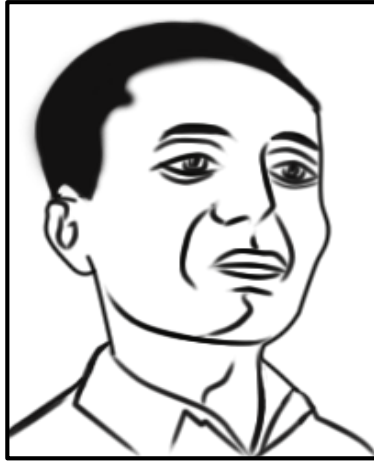
Larawan ni Luis Taruc, isang lider na nagtatag ng kilusang Hukbong Bayan Laban sa Hapon o HUKBALAHAP