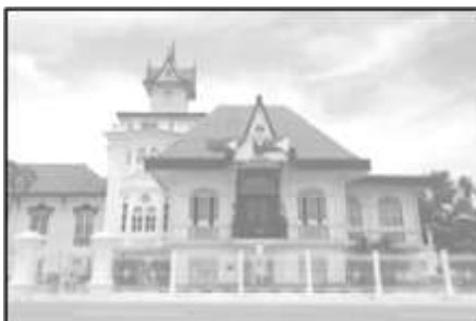
Lumang Bahay ni Heneral E. Aguinaldo

Ang museo ay isang lugar o gusali na pinaglalaman ng mga bagay na may kinalaman sa kasaysayan at mga bagay na may kinalaman sa sining at siyensiya. Kabilang na sa mga museo sa Pilipinas ay ang “National Museum” o Pambansang Museo na itinakdang pamahalaan bilang espesyal na lagakan ng mga pamanang bansa. Dito nakatago ang mahalagang kagamitan na ginamit ng mga unang Pilipino at mga dakilang bayani ng bansa.