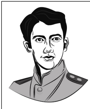
Heneral Gregorio H. del Pilar